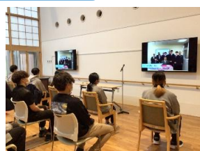
ビデオメッセージ上映

令和6年度新入職員5人が晴れてチューターから卒業することとなり、一人ひとりに先輩職員からビデオメッセージが贈られました。1年間の思い出に感極まって涙あり、笑いありの心温まるひと時でした。