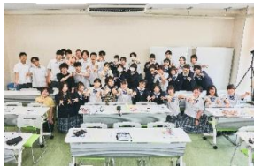
尚志高校のみなさんと

福島県主催の「ふくしまふくしまらいキャンパス」にて、うねめの里の若手職員が講師として登壇しました。この取り組みは、福祉・介護の世界で活躍する若手が、高校生へ直接「仕事の魅力」や「リアルな声」を届けることを目的としたものです。