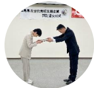
県中地方振興局にて